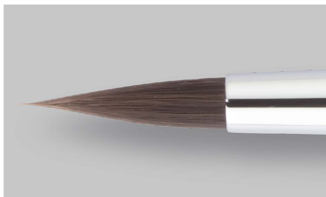
바이오닉 헤어로 만든 고품질 브러시

보관 실수 등으로 팁이 휘어진 경우 90°C 정도의 뜨거운 물에 잠시 보관하면 붓 끝이 퍼지면서 원 상태로 돌아옵니다